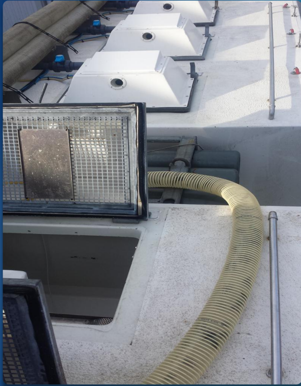
Norsk oppdrettsservice Flekkefjord